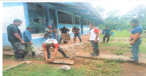
Foto 3: Se evidencia el inicio de la demolicion de la losa anterior para luego baciir la nueva.