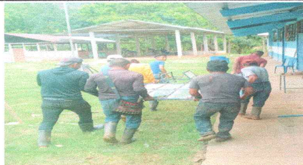
Foto 2: Se logra apreciar los balcones que se estan desinstalando para instalas las nuevas.