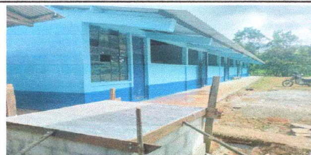
Foto 5: Se evidencia el avencie de la rehabilitacion de la base del tinaco.