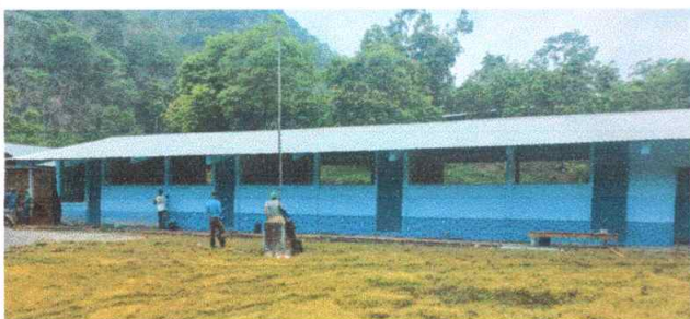
Foto 1: En la imagen se logra apreciar el trabajo de pintura hasta la presente fecha.